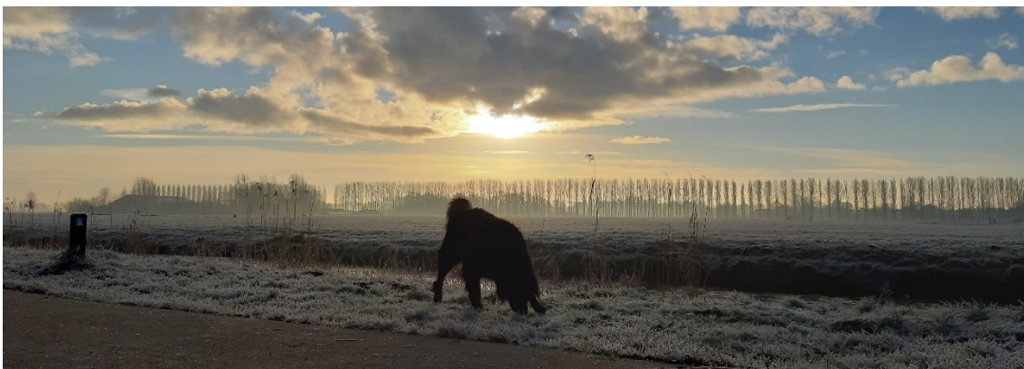
Blik op Lewenborg bij het krieken van de dag

We vertrouwen het onze badmintonspelers toe dat zij zich ontworstelen aan die greep. Het zijn bij onze club vooral recreatieve sporters. Spelers in een fysiek gezelschapsspel. Waar je mekaar een kunstje flikt. Uithalen voor een smash en toch een dropje van je racket neer laten dwarrelen. Lachen als het lukt. Maar het is wel sport. Je moet echt je best doen om het die andere kant van het net moeilijk te maken. Veel bij onze vereniging die er zo inzitten. Voor de fun maar het moet ook iets voorstellen. Het lijf moet merken dat er dringend beroep op wordt gedaan. Zulke lieden blijven nu niet binnen hangen op de bank. Die gaan er op uit. Wandelen, fietsen, draven. Hebben sneeuwpret, hebben geschaatst. We komen ze tegen in en rondom Lewenborg. Al dan niet met hond of gezin. Met slee en gebreide muts. Met stevige stappers of rennend op nike-airs. Ga door. Ga vooral zo door. Straks moet je er weer staan. Met je racket op de baan.